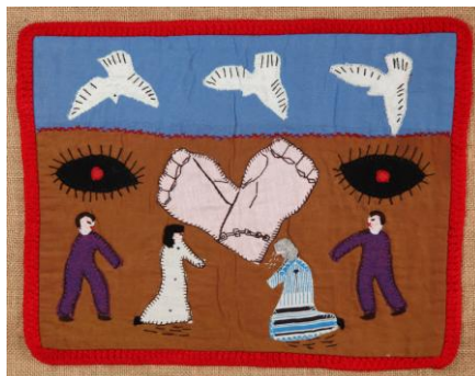
¿Dónde están nuestros hijos?