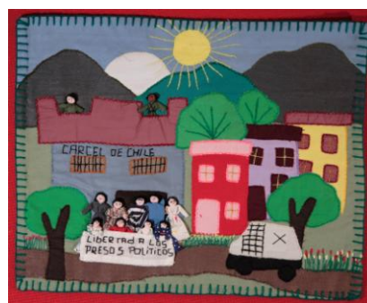
Libertad a los presos políticos

Quisiera referirme, antes de terminar mi presentación, a otro ámbito más allá de la resistencia, de su potencialidad como Arpilleras Embajadoras . Se refiere a la posibilidad que se ha dado con las arpilleras de sacarlas más allá de las esferas del mundo de la solidaridad, de las afinidades socio-políticas, del apoyo humanitario, para convertirlas en protagonistas en espacios jamás antes imaginados para ellas. Han sido exhibidas en museos, salas de arte, universidades, centros comunitarios y han recorrido el mundo. Están en el Museo de la Memoria de Chile que se inauguró en enero del 2010. Se han resistido a ser simples trabajos textiles de mujeres, confinados a los espacios que la sociedad les asigna.