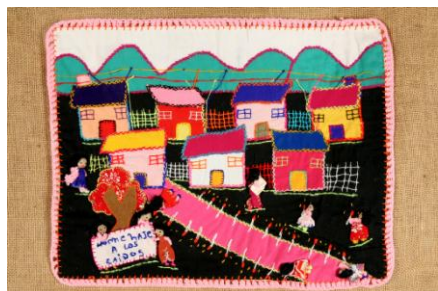
Homenaje a los caídos