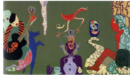
La Trilla de Bordadoras de Isla Negra