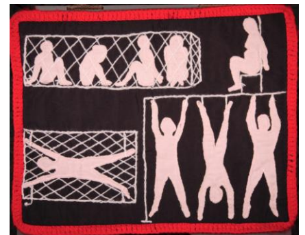
Sala de torturas

Jorge Semprún Maura, de nacionalidad española, se trasladó con su familia a Francia y luego a la Haya en los comienzos de la Guerra Civil. Su padre fue diplomático y representó al gobierno republicano hasta 1939. Cuando los Países Bajos reconocieron el gobierno de Franco, la familia se fue en calidad de refugiada a Francia. Allí hizo estudios académicos en la Sorbona. Cuando los nazis ocuparon Francia se enroló al partido comunista para luchar en la