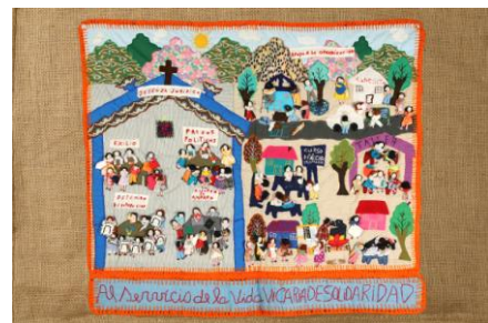
Vicaría de Solidaridad

La memoria es la capacidad mental que posibilita a un sujeto registrar, conservar y evocar las experiencias (ideas, imágenes, acontecimientos, sentimientos, etc.). El Diccionario de la Lengua de la Real Academia Española la define como: «Potencia del alma, por medio de la cual se retiene y recuerda el pasado».