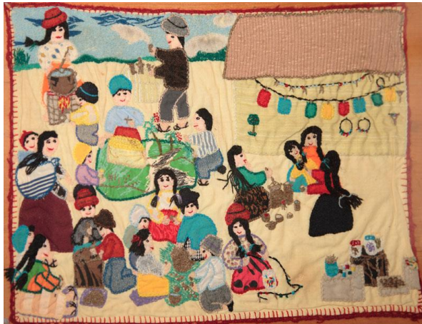
Recuerdos de Guadalupe Guadalupe Callocunto, Perú enero 1990 Guadalupe Ccallocunto fue detenida en su hogar de Ayacucho el 10 de junio de 1990 mientras dormía con su hija menor. Desde entonces se encuentra desaparecida.