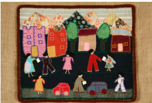
Panfleteando en el 1979